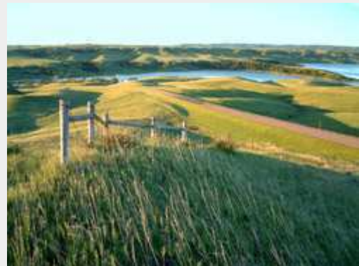
NW Iowa Tour